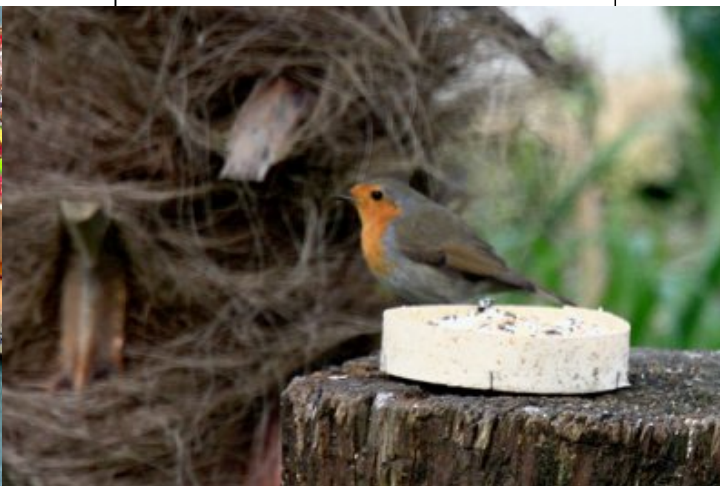
Rougegorge familier devant la boîte !