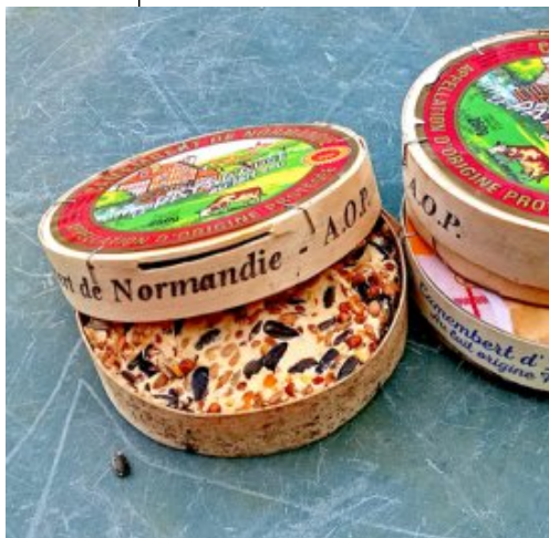
Utilisation des boîtes de camembert.