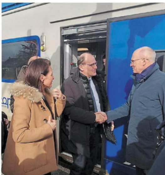
La présidente de la Région Pays de la Loire Christelle Morançais et le PDG de la SNCF Jean Castex ont fait escale à Savenay pour parler des "irrégularités" sur la ligne allant jusqu'à Nantes.

C'est surtout un axe sous-tension, de plus en plus fréquenté mais aussi en proie à des « petits problèmes », reconnaît Jean Castex. « Sa régularité s'est dégradée. » Une baisse de 3,7 % a été constatée par rapport à 2024, avec