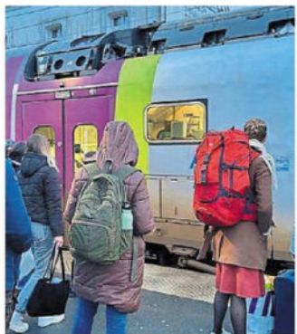
Des usagers sur les quais de la gare de Savenay.